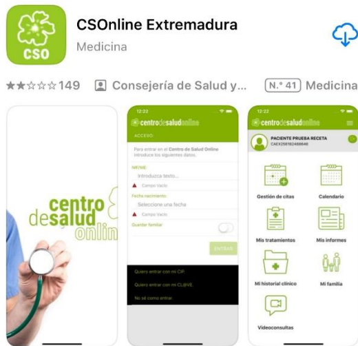
Imagen 2: Introducción a la App “Centro de Salud Online”