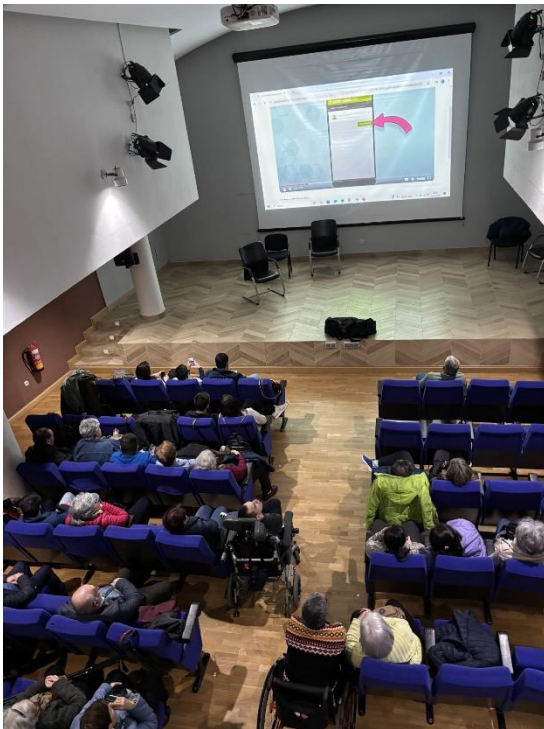
Imagen 1: Actividad Comunitaria