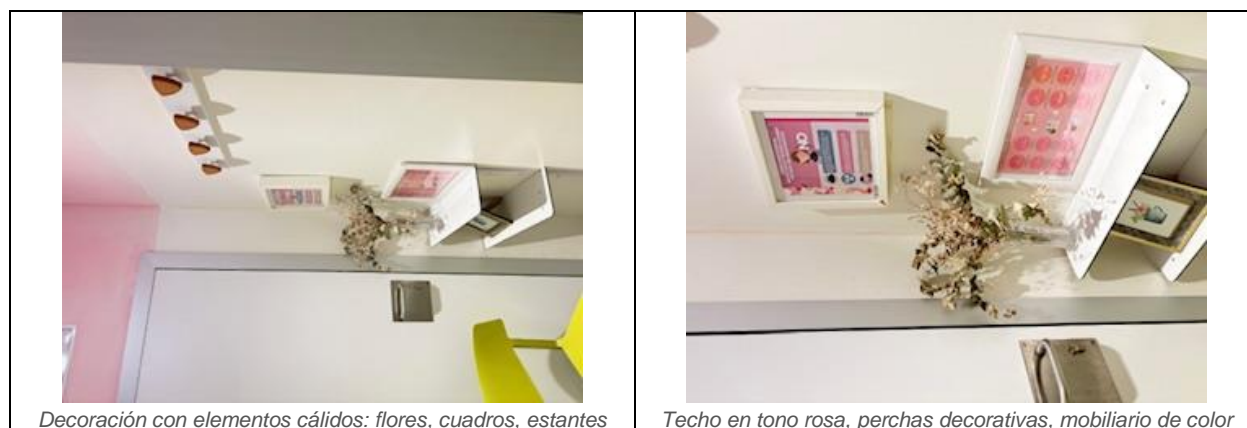
Decoración con elementos cálidos: flores, cuadros, estantes