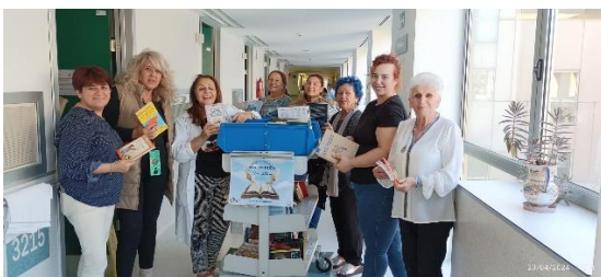
Reparto de libros por las unidades de hospitalización del HGUSL