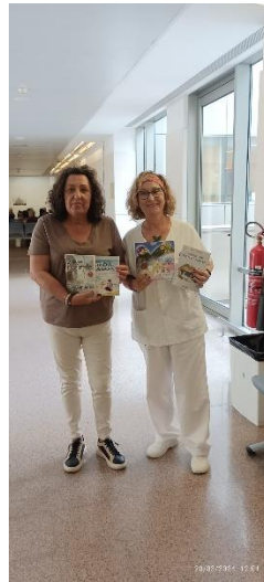
Autora haciendo donación de sus libros