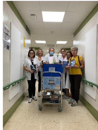
Reparto de libros por las unidades de hospitalización en el HSMR