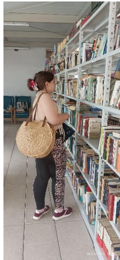
Familiar eligiendo un libro en nuestra biblioteca