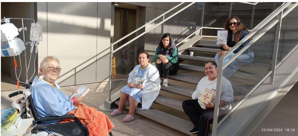
Pacientes en la palnta terraza al aldo de la biblioteca, disfrutando del sol y de un buen libro donado