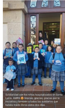
Solidaridad con los niños hospitalizados en Santa Lucía. AMPA 🙏 Gracias, gracias, gracias por la iniciativa y también a todos los solidarios que habéis traído libros estos dos días.