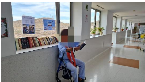
Uno de los puntos de minibibliotecas en una planta de hospitalización del HGUSL (con un paciente leyendo)