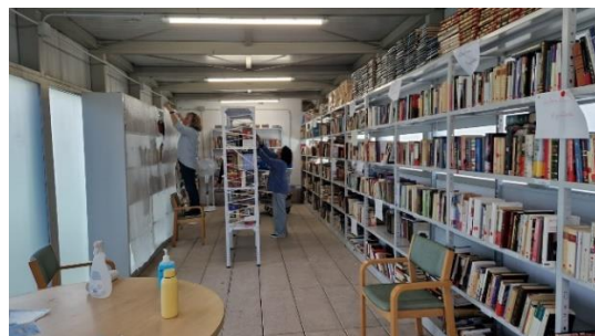
Los profesionales organizando en la biblioteca, los libros recogidos del almacén