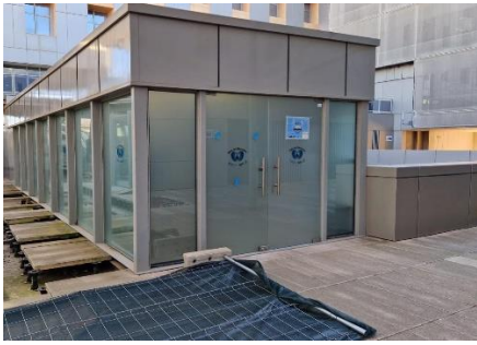
NUESTRA BIBLIOTECA. Ubicada en la planta terraza del HUSL