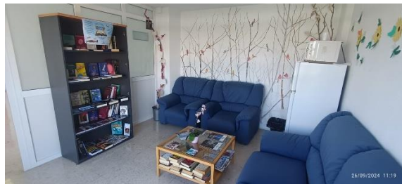
Uno de los puntos de minibiblioteca en la unidad de palitivos del HSMR