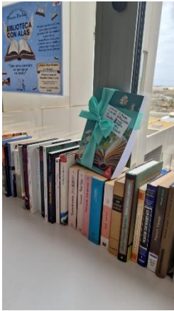
Libro donado por un paciente y colocado en una de las minibibliotecas