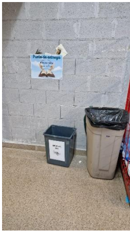
Punto de recogida de libros del HGUSL recién recogido de libros