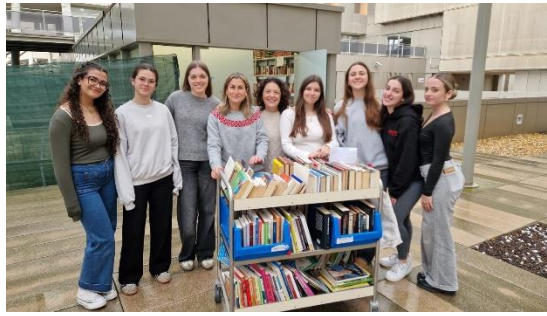
Alumnos voluntarios de la UCAM con dos profesionales con el carro biblioteca preparado para subir a iniciar el reparto