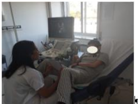
Nivel-4. Realización de la exploración