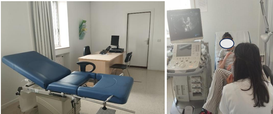
ANEXO I. CAMILLA ADAPTADA