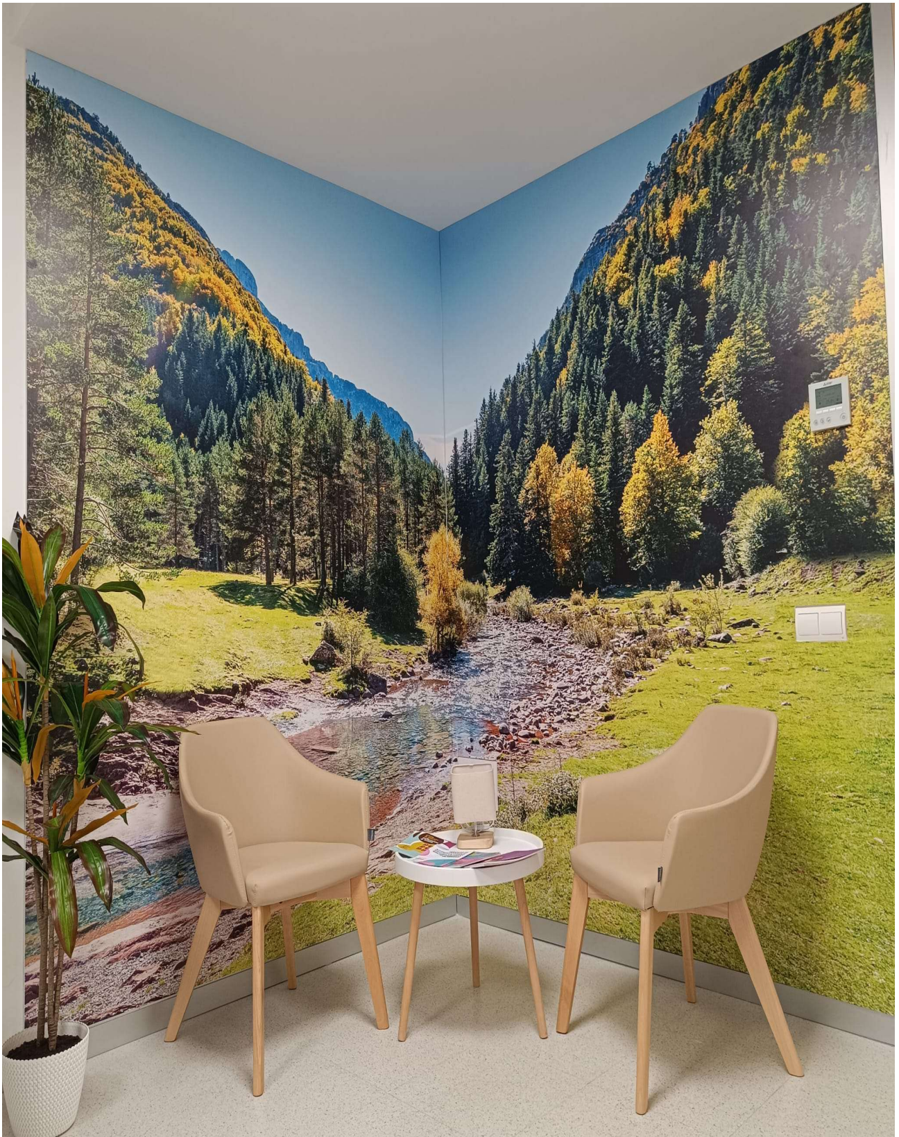
Centro de Salud Huerta de la Reina y Equipo de Atención a la Mujer. Córdoba