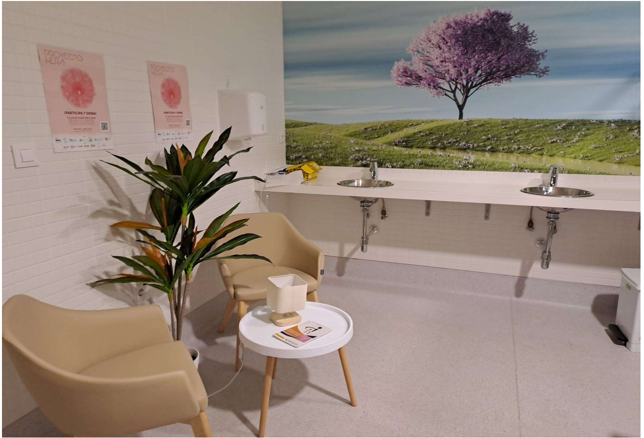
Centro de Salud Carlos Castilla del Pino. Córdoba