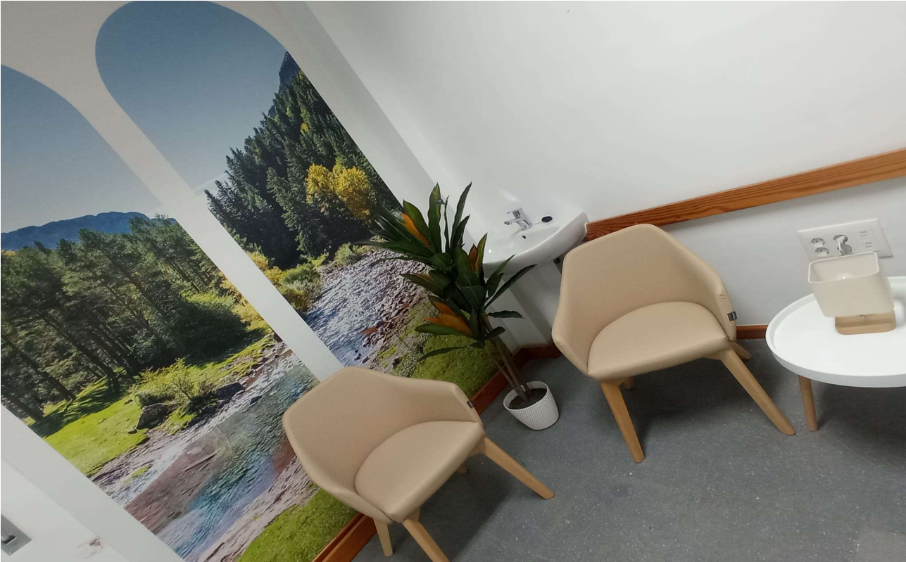
Centro de Salud La Carlota.