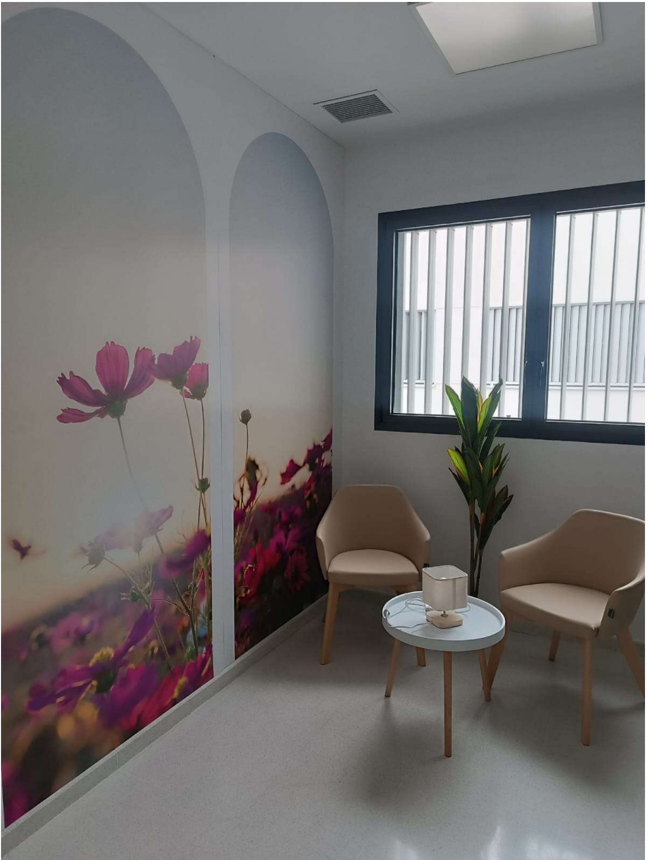
Centro de Salud de Montoro.