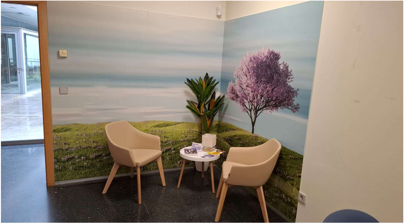
Centro de Salud Lucano. Córdoba