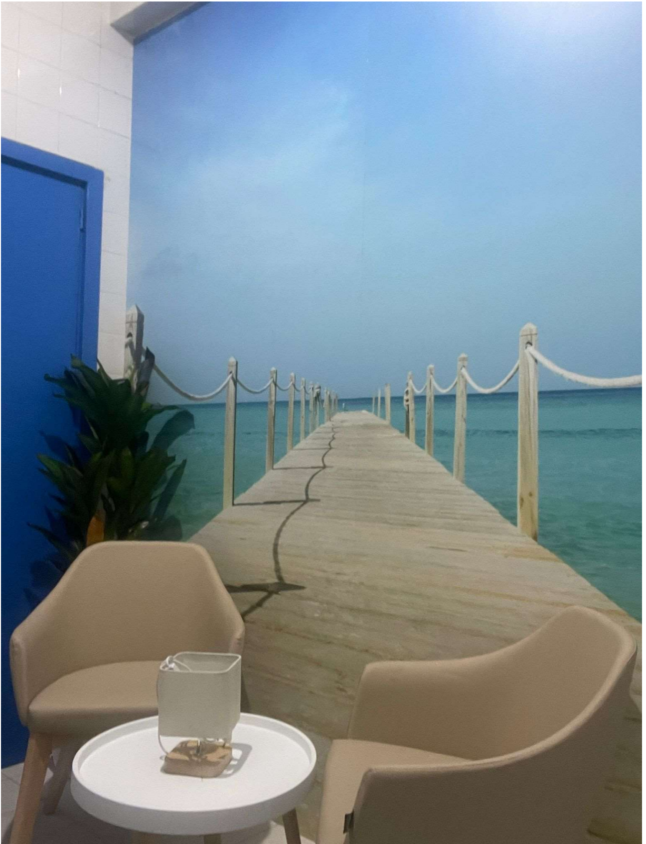
Centro de Salud Guadalquivir. Córdoba