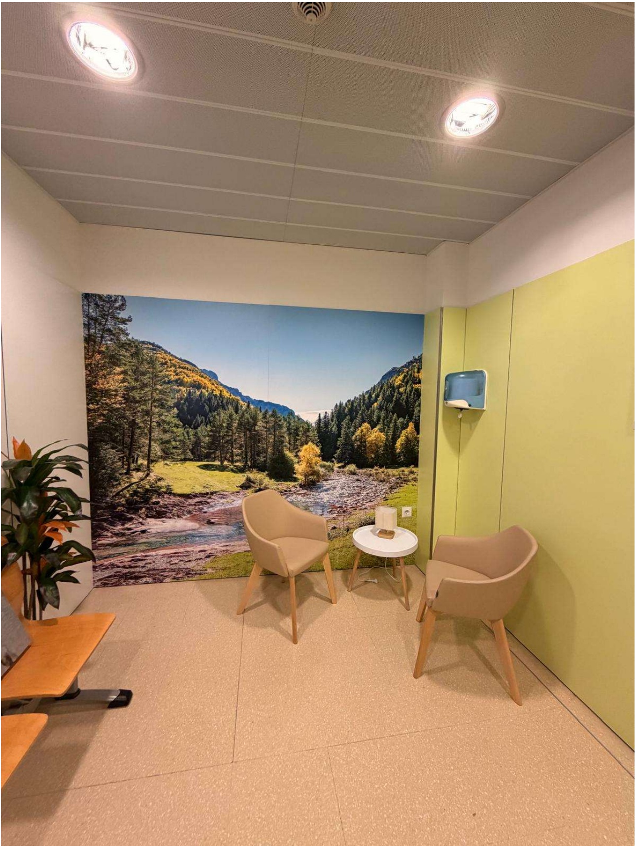
Servicio de Urgencias (SUAP) Carlos Castilla del Pino. Córdoba