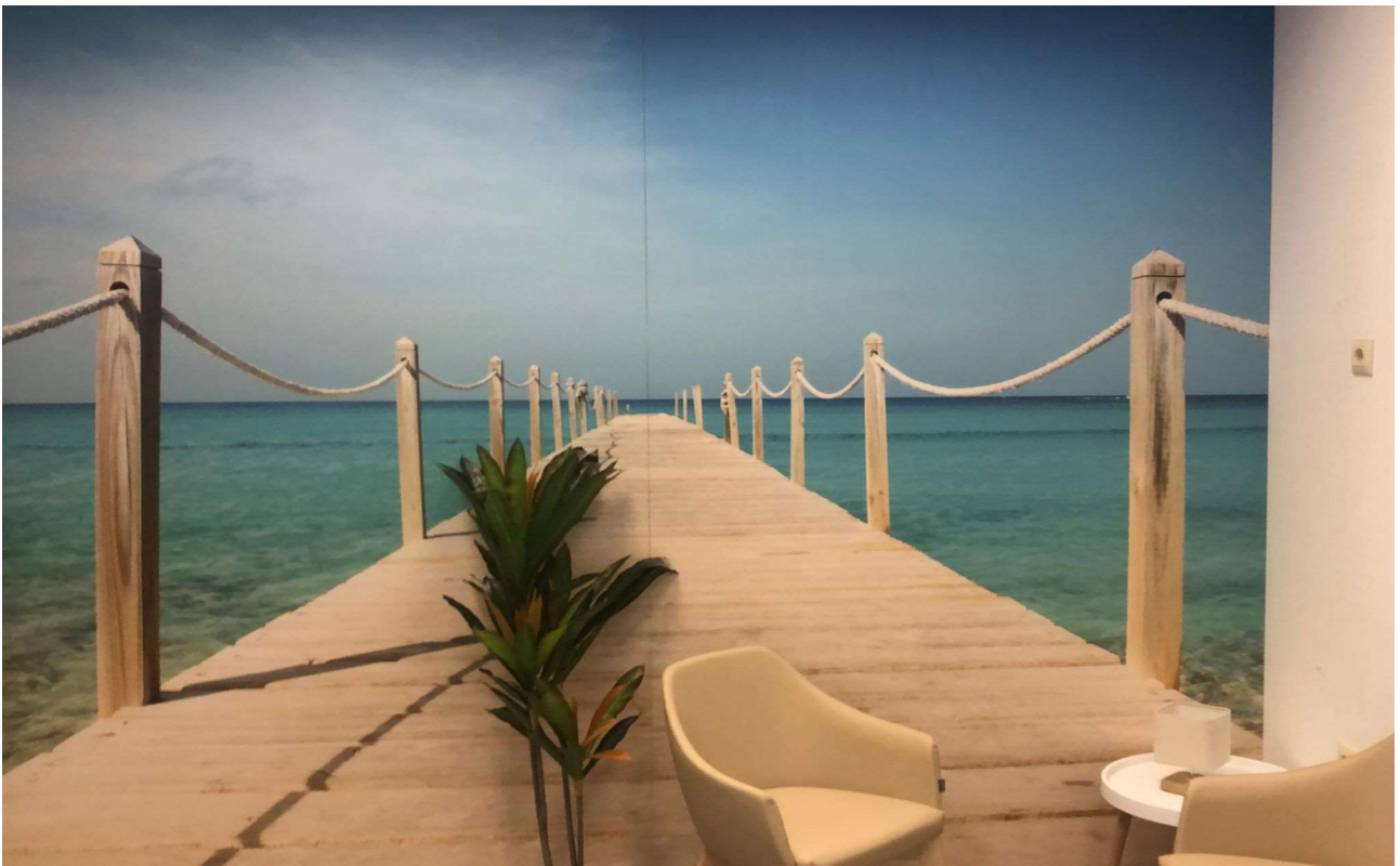
Centro de Salud de Villaviciosa.