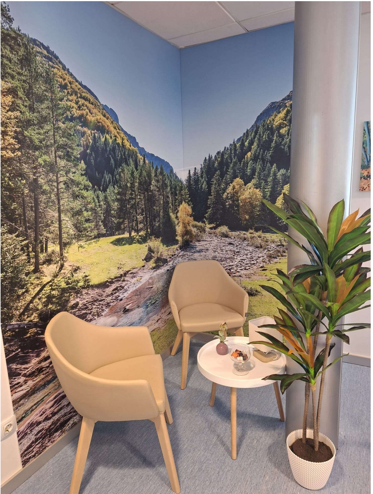
Centro de Salud Sector Sur. Córdoba