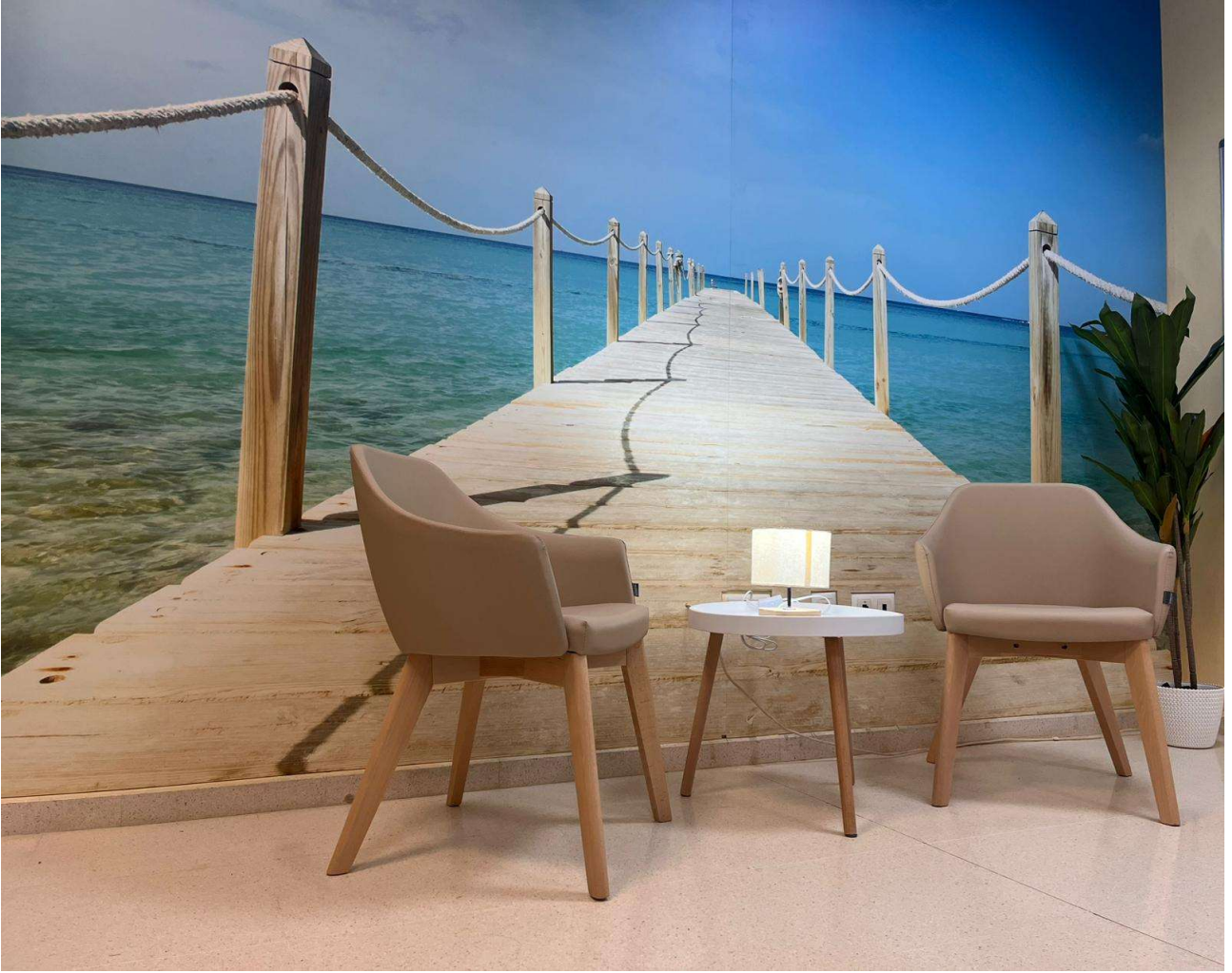
Centro de Salud Fuente Palmera.