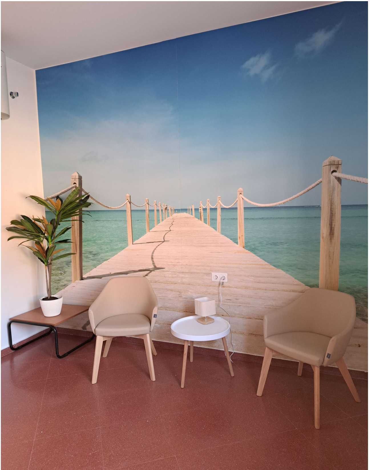
Centro de Salud de Poniente. Córdoba