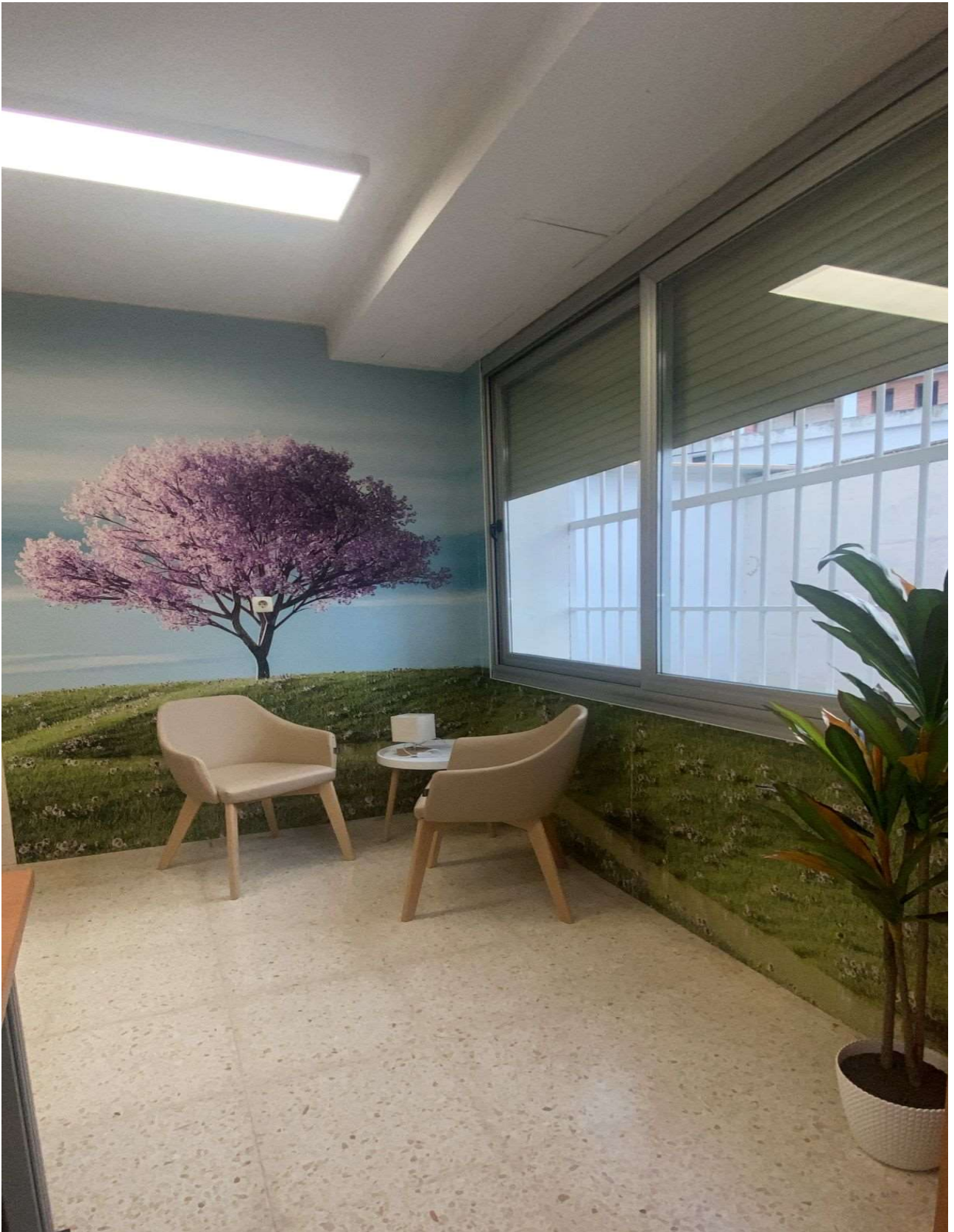
Centro de Salud de Fuensanta. Córdoba