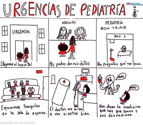
Cartel de secuencias de la Urgencia

En la sala de enfermería hay carteles con pictogramas de algunas pruebas de las consultas. Si lo necesitas solicítalo.