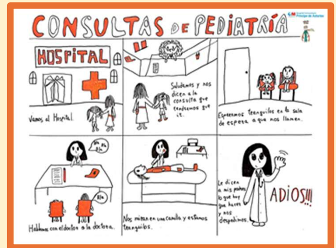
Cartel de secuencias de las Consultas