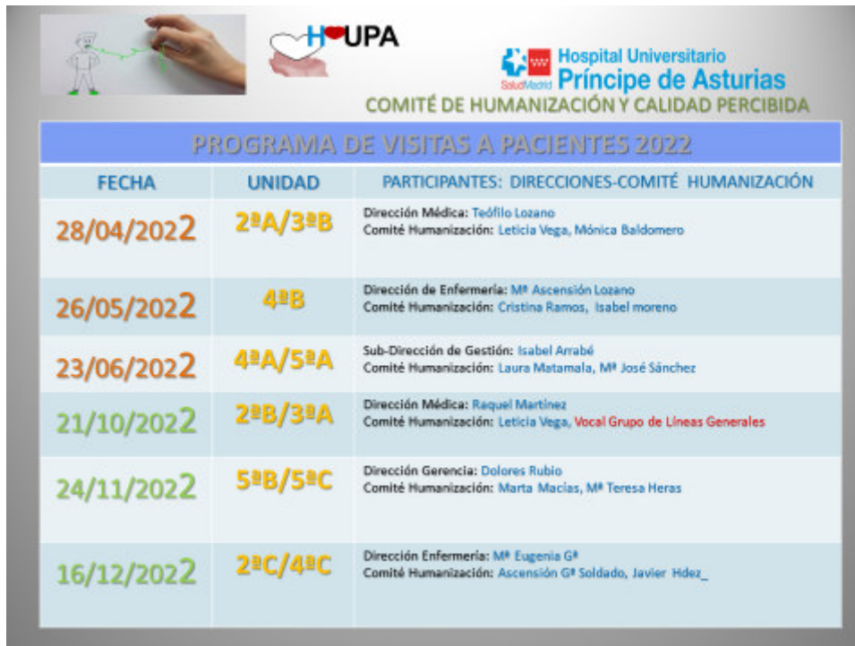
Anexo 2: Evolución Programa de Visitas de Humanización 2018-2022