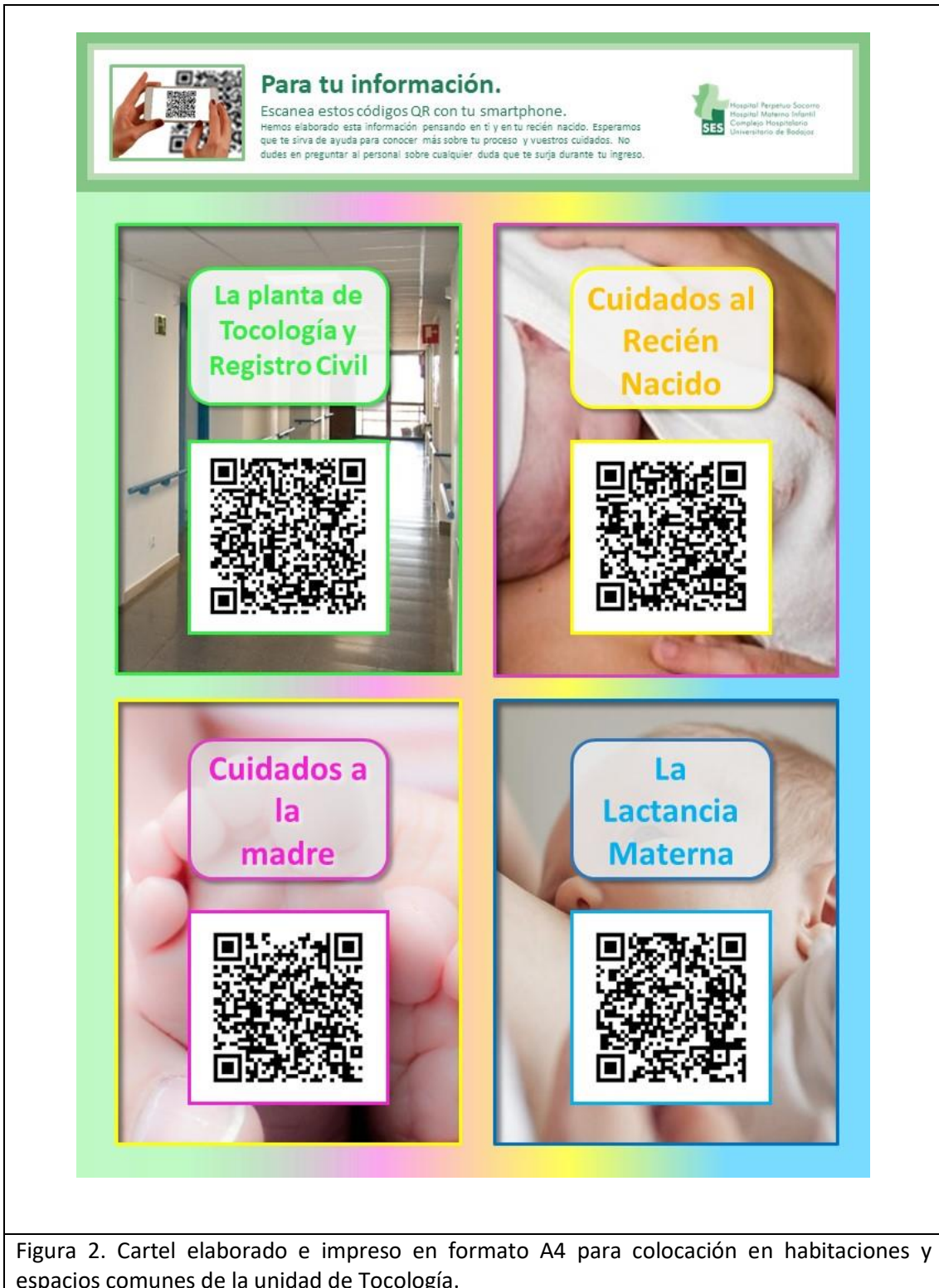
Figura 2. Cartel elaborado e impreso en formato A4 para colocación en habitaciones y espacios comunes de la unidad de Tología.

en dos versiones: vertical y apaisado, eligiendo por acuerdo de los participantes el formato vertical.