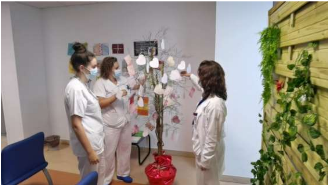
Figura 6: Árbol de los Deseos colocado en la sala de espera a disposición de pacientes, familiares y acompañantes.

En la sala de espera se ha puesto a disposición de pacientes, familiares y acompañantes s un árbol que hemos llamado el Árbol de los Deseos (Figura 6) en cuyas ramas se pueden colocar tarjetas en formas de rectángulo y corazón en las que previamente se ha escrito un deseo, a lo que hemos llamado Plantar un Deseo (Figura 7).