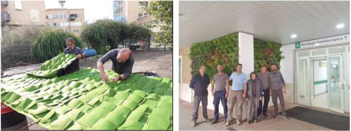
Figura 5: Equipo de jardinería del HUVR en la elaboración y ejecución del Jardín vertical a la entrada principal de Oncología Radioterápica.

En la sala de espera se ha puesto a disposición de pacientes, familiares y acompañantes s un árbol que hemos llamado el Árbol de los Deseos (Figura 6) en cuyas ramas se pueden colocar tarjetas en formas de rectángulo y corazón en las que previamente se ha escrito un deseo, a lo que hemos llamado Plantar un Deseo (Figura 7).