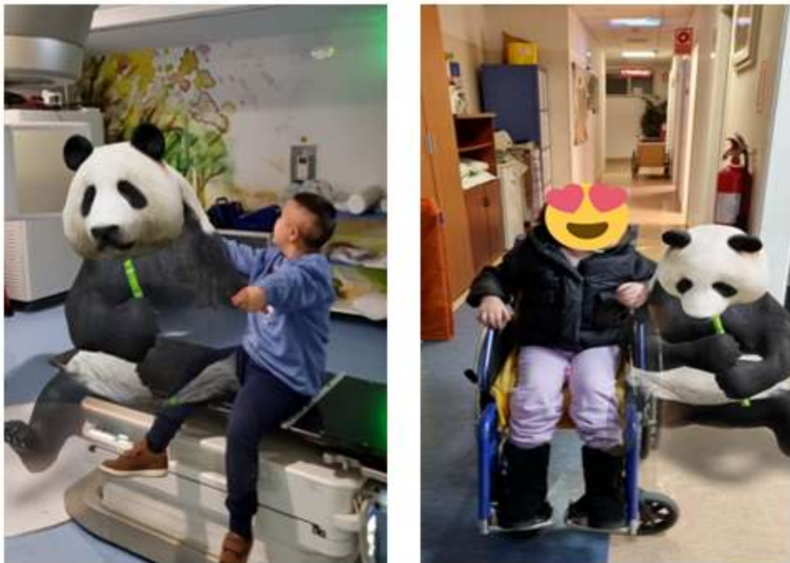
Figura 9: Fotos en las Unidades de Tratamiento con mascotas virtuales favoritas.

Además se han colocado luces led con decoración de acuarios (Figura 10) en los techos de las zonas reservadas para que se ubiquen los pacientes que acuden en camilla. La idea es hacer que su espera antes de recibir la radioterapia sea más llevadera.