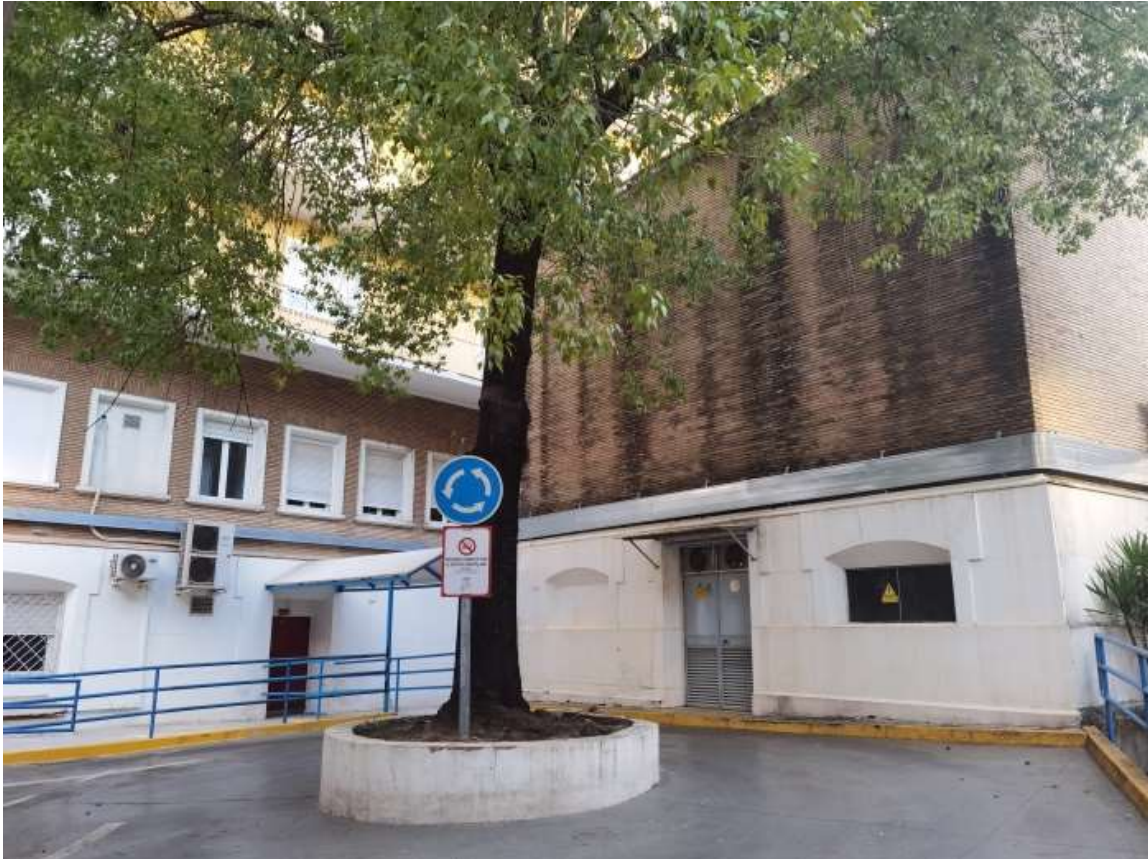
Figura 2. Glorieta frente a la entrada principal de Oncología Radioterápica donde se prevé en la segunda fase del proyecto (Enero-Julio 2023) un espacio ajardinado y un mural de grafiti en la pared de ladrillo visto.

También está ya presupuestado (Figura 3) por parte del Hospital un mural con un Entorno Natural para ubicarlo en la Sala de Espera que dé continuidad con esta imagen llena de luminosidad y profundidad al Jardín de la Rterapia. Para ayudar a que el tiempo que pasa el paciente en la unidad sea de mayor calidad se van crear conceptos de “Gameology”, gracias al cual, el paciente, desde su dispositivo móvil, puede interactuar con el entorno mediante un código QR emplazados a lo largo de todo este Jardín y disfrutar reconociendo las plantas y mariposas que se encuentran a su alrededor, para poder consultar su aspecto real y conocer más sobre ellas y las especies vegetales.