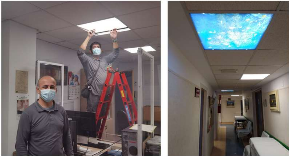
Figura 10: Equipo de mantenimiento colocando luces led con decoración de acuarios en los techos de las zonas reservadas para que se ubiquen los pacientes que acuden en camilla.

En la sala de espera de pacientes adultos también hemos colocado una estructura de madera con plantas (antes estructura metálica) para separar espacios aportando una imagen acorde con este nuevo entorno (Figura 11). Además, se ha dotado de una fuente de agua la entrada de la Unidad.