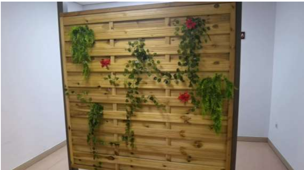
Figura 11: estructura de madera con plantas para separar espacios aportando una imagen acorde con este nuevo entorno ajardinado.

En la sala de espera de pacientes adultos también hemos colocado una estructura de madera con plantas (antes estructura metálica) para separar espacios aportando una imagen acorde con este nuevo entorno (Figura 11). Además, se ha dotado de una fuente de agua la entrada de la Unidad.