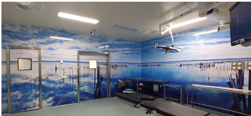
Figura 2: Imagen de la decoración del quirófano con la iniciativa “El quirófano, una estancia más amable”.

Todos sabemos que los quirófanos resultan fríos e impersonales. El tiempo de espera en el quirófano hasta el inicio de la inducción, asocia un grado de estrés y ansiedad para el paciente, aumentando la vulnerabilidad percibida. Es un ambiente desconocido, está desprovisto de todas sus pertenencias, no tiene la presencia de ningún acompañante y con la incertidumbre de cómo se desarrollará la cirugía. Con la iniciativa “El quirófano, una estancia más amable” deseamos disminuir la ansiedad y el miedo, proporcionando un entorno confortable para el paciente, favoreciendo circunstancias que mejorarán la relación directa con el equipo quirúrgico (anestesiólogos/os, cirujanas/os y enfermeras/os).