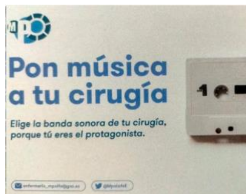
Figura 1: Pegatina informativa de la iniciativa “Pon música a tu cirugía”.

Por un lado, el programa “Pon música a tu cirugía” : programa de empoderamiento y humanización de la asistencia al paciente sometido a cirugía abdominal mayor oncológica dentro del programa de Medicina Perioperatoria del Hospital Universitari i Politècnic la Fe. Este programa se plantea como estrategia para disminuir la ansiedad, disminuir el dolor y empoderar al paciente, implicándolo activamente en sus cuidados cuando se somete a un procedimiento quirúrgico. El tiempo de espera en acogida prequirúrgica, asocia un grado de estrés y ansiedad para el paciente ya que es un ambiente desconocido, desprovisto de todas sus pertenencias, sin la presencia de ningún acompañante y con la incertidumbre de cómo se desarrollará la cirugía. El tiempo desde la entrada en el quirófano hasta que el paciente se encuentra sedado o bajo anestesia general requiere en ocasiones la realización de técnicas locorreregionales siendo recordado por el paciente como especialmente estresante. Se ha de procurar un ambiente calmado y relajado, y de manera general se evita el tránsito de profesionales y las conversaciones innecesarias.