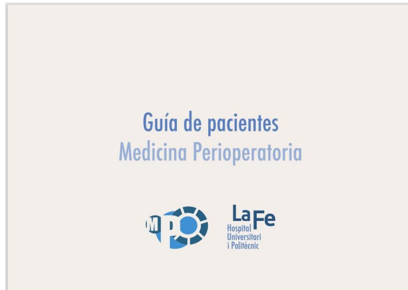
Figura 3: Imagen del folleto informativo entregado a las/los pacientes en la consulta.

El paciente puede acceder a la información desde casa "Folletos informativos para Pacientes":