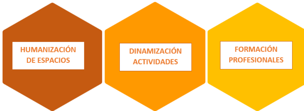
Figura 1. Líneas principales de trabajo del Programa DOMUM.

El enfoque del programa DOMUM se desarrolla mediante tres líneas principales de trabajo : la remodelación de los espacios de espera oncológicos, la realización de actividades psicosociales, y el apoyo a la formación del personal sanitario en aspectos relacionados con la humanización.