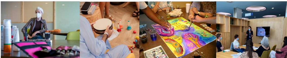
Figura 3. Actividades realizadas en diferentes espacios DOMUM.

Más allá de los espacios y las actividades, la tercera línea del proyecto ofrece recursos y estrategias a profesionales sanitarias para mejorar la relación con sus pacientes y prevenir el estrés y el burnout. DOMUM ofrece formaciones a los profesionales para mejorar las habilidades comunicativas y la relación que establecen con sus pacientes que, a su vez, les da herramientas para su propio bienestar emocional para prevenir, entre otros, el síndrome del burnout.