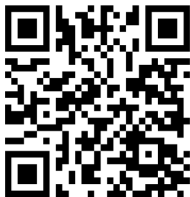
QR Vídeo del Protocolo de Intimidad

-Se evitará hacer comentarios de la intimidad de un tercero en público.