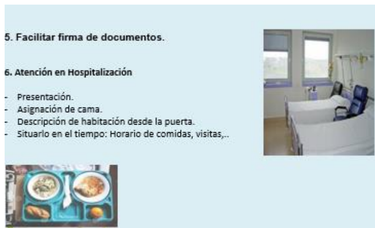
Imagen de decálogo de actuación