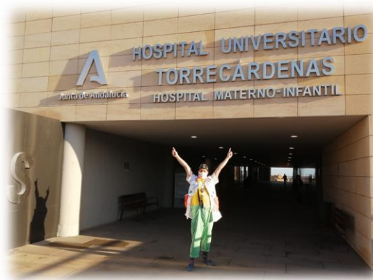
Imagen 1. Entorno acceso Hospital General y Materno Infantil