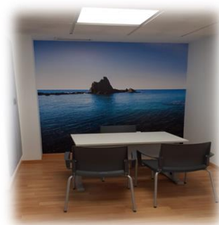
Imágenes 4. Sala comunicación malas noticias y atención inicial al duelo Urgencias y Hospitalizació