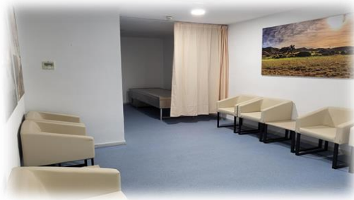
Imágenes 3. Mortuorio